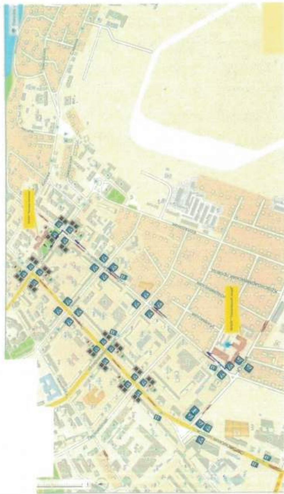
Схема движения учащихся МАОУ «Технический лицей» к МАОУ «Русская гимназия»